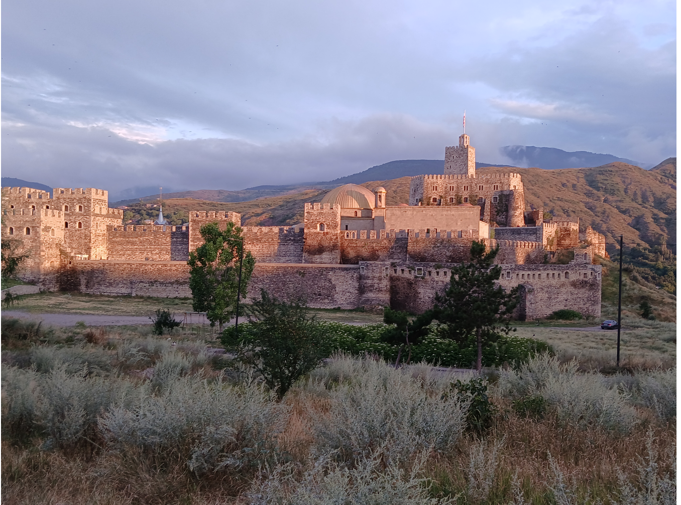
Figure 6: Hrad Rabati