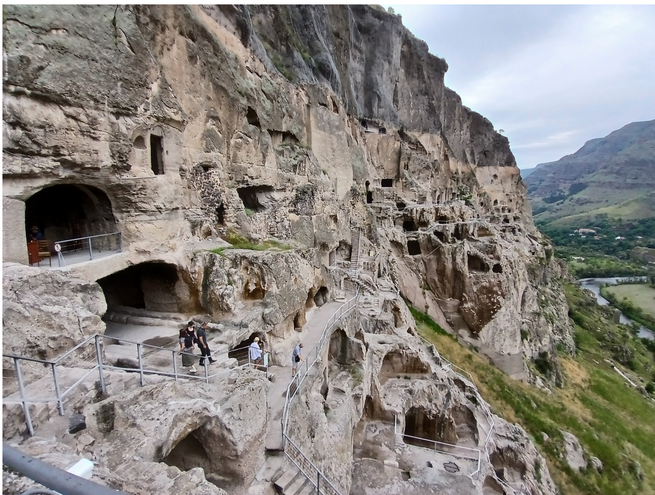
Figure 5: Skalní město Vardzia