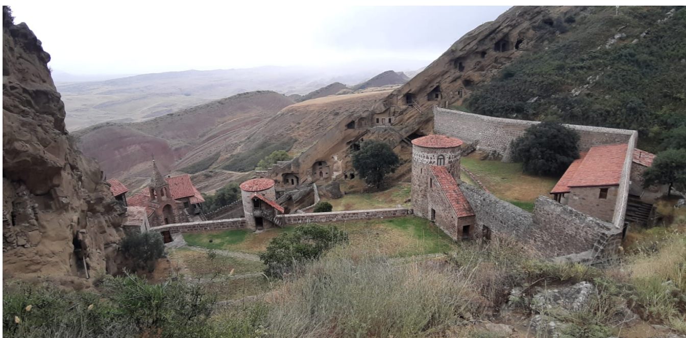
Figure 4: Klášter David Garedži