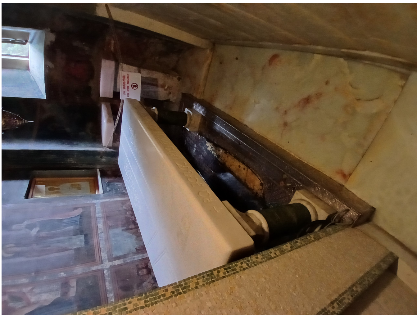
Figure 3: Hrob sv. Nino v Bodbe