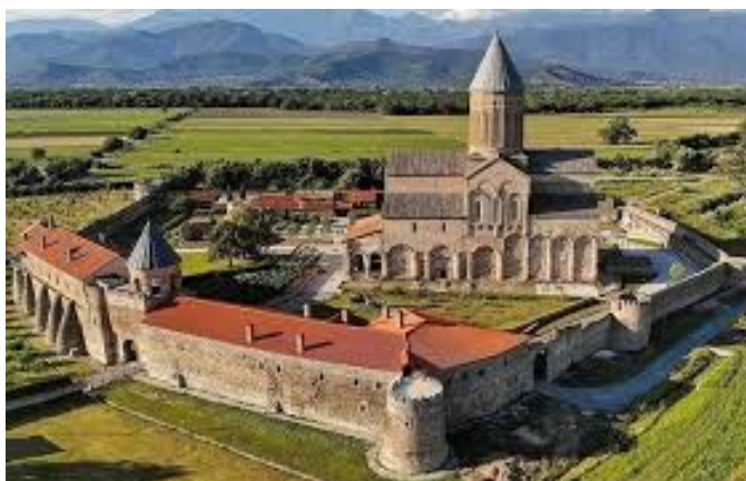
Figure 1: Klášter Alaverdi