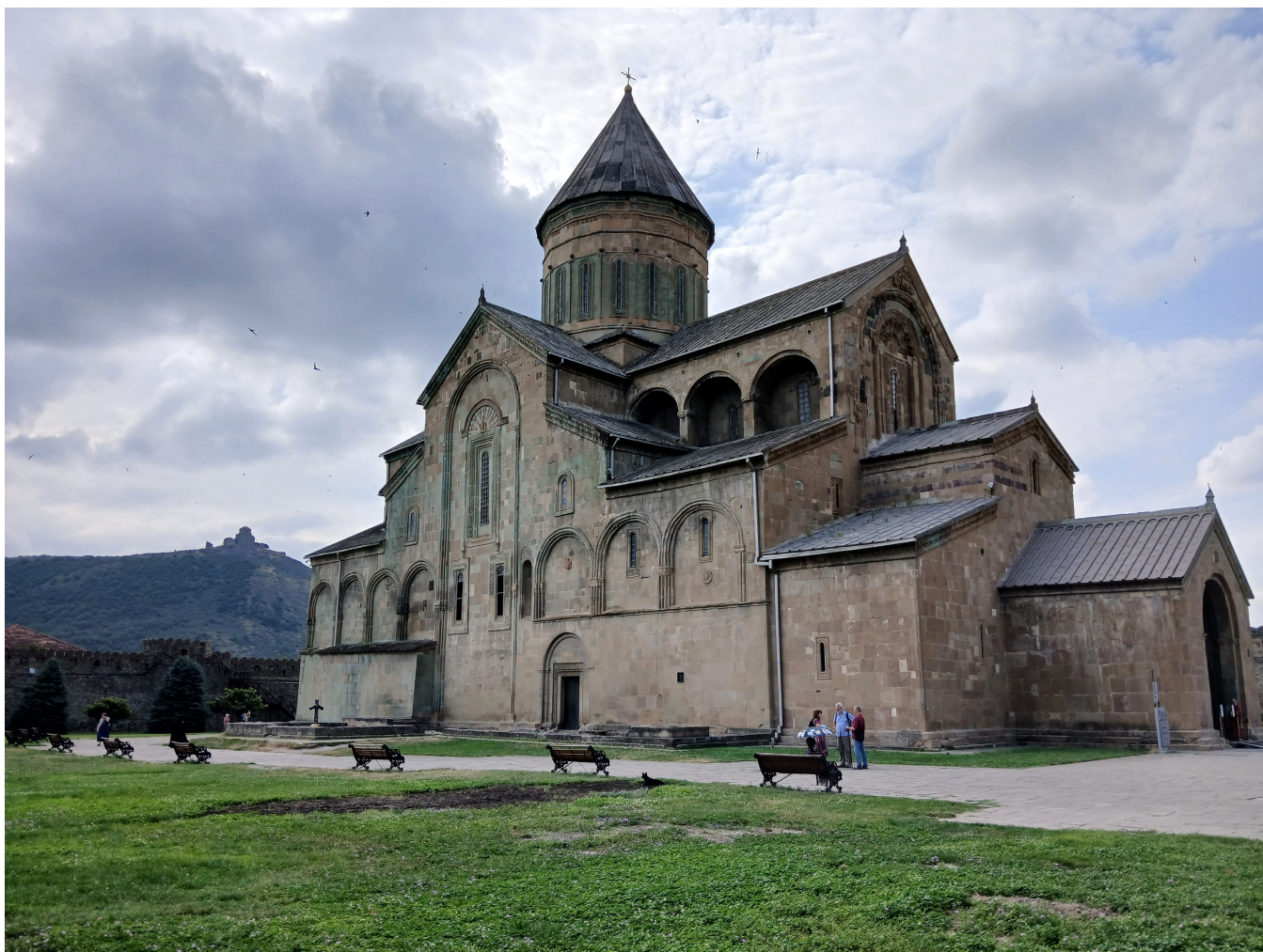
Figure 10: Mtskheta, katedrála Svetitskhoveli