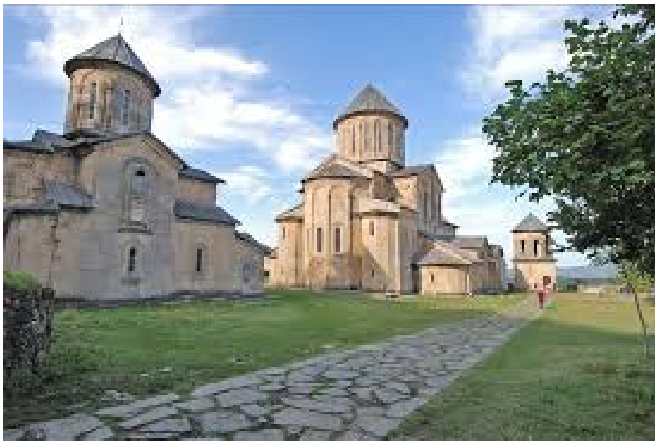
Figure 8: Klášter a akademie Gelati