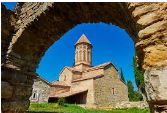
Figure 2: Klášter Ikalto