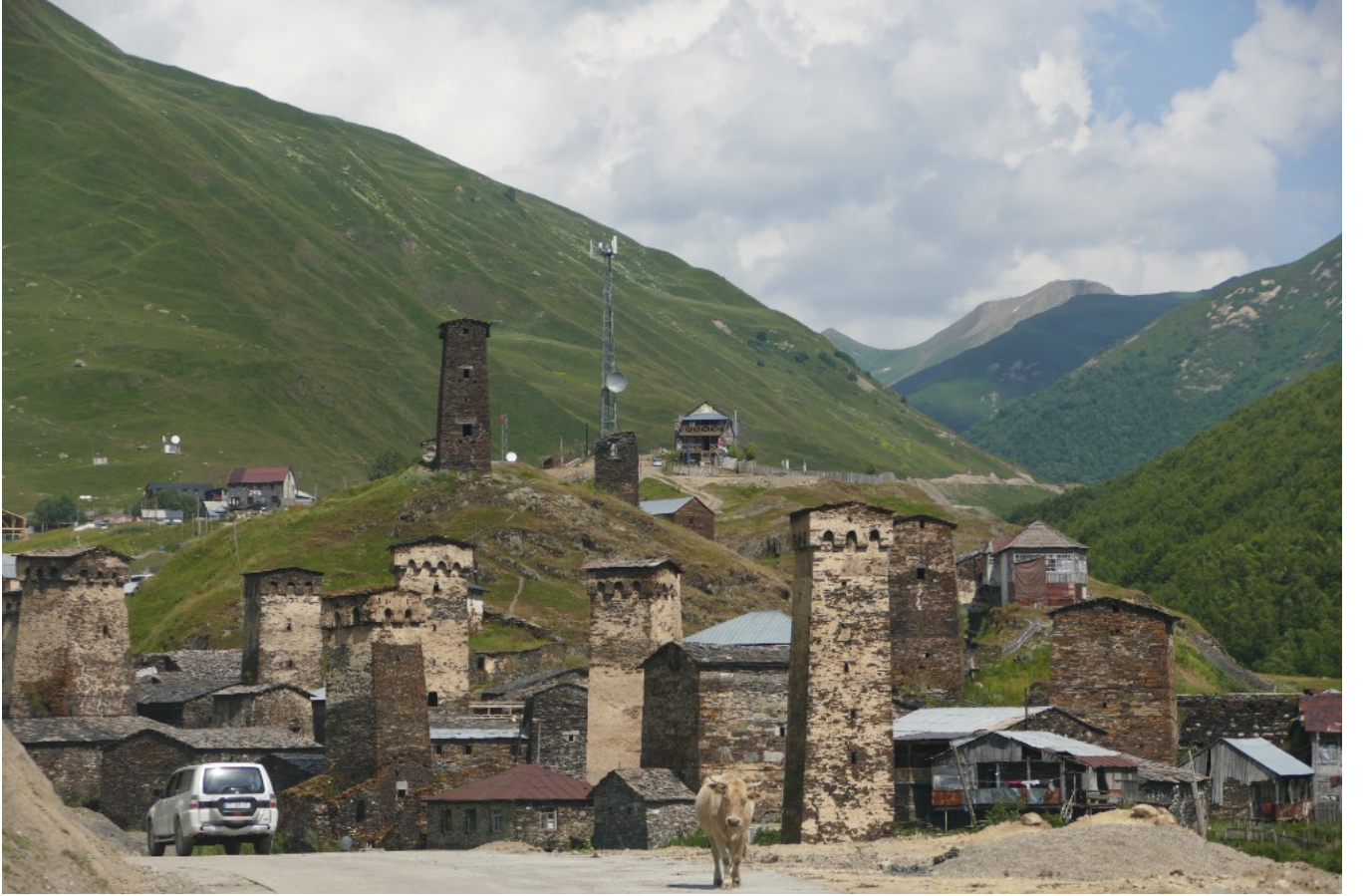
Figure 9: Vesnice Uşguli ve Svanetii