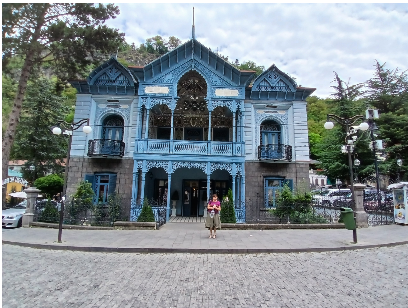
Figure 7: Bordžomi, bývalé sídlo perského velvyslance